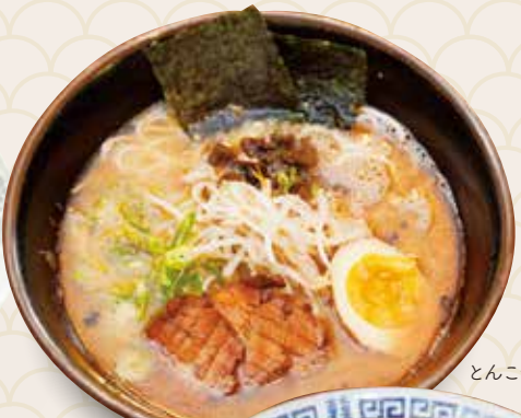
熊本 とんこつラーメン