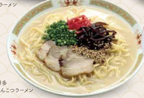
博多 とんこつラーメン