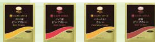
タヒチ風ビーフカレー ジャワ風ビーフカレー バターチキンカレー 欧風ビーフカレー

素材の味をいかし、エキス類も 最小限に抑えてすっきりとした 味わいに仕上げました。