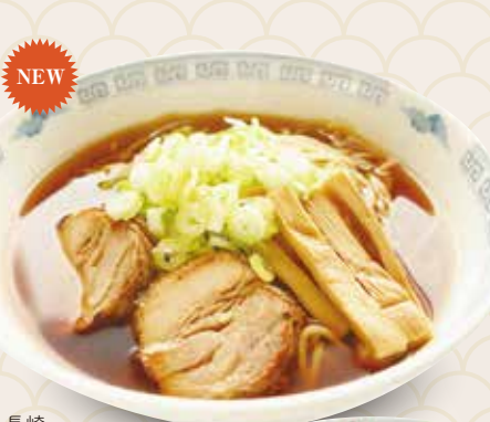
長崎 あごだしラーメン