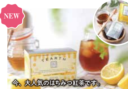
29 はちみつ紅茶 ティーバッグ ¥1,080 (税込) 軽