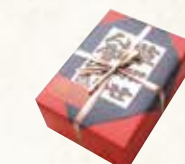
25 草加せんべい (赤) ¥1,080 (税込) 軽

特定原材料：小麦・卵 内容量：醤油4枚 胡麻4枚 切り海苔2枚 海苔・白砂糖・七味唐辛子・ざらめ 各1枚 賞味期限：180日 (株)東彰