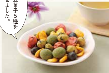
27 豆みつくす 夏ver. ¥930 (税込) 軽

特定原材料：小麦・乳・落花生 内容量：竹炭豆・海苔わさび豆・ 抹茶みるく豆・カレーそら豆・梅干豆・ 各4袋 賞味期限：120日 徳永製菓(株)