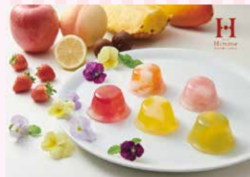
23 ひととえ ピッコロドルチェ ¥1,140 (税込) 軽

1つのゼリーに2つの果実の味わい。 キラキラ輝く、見た目もかわいいプチデザート。