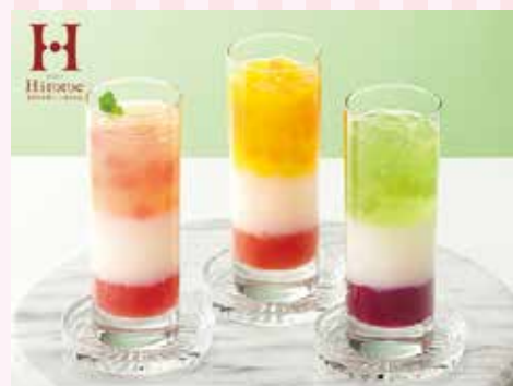
22 ひととえ 3層デザート ジュレパフェ ¥1,570 (税込) 軽

特定原材料：乳 内容量：ピーチ&グレープフルーツ味 (103g) ×2個 マンゴーミックス味 (103g) ×2個 ラ・フランスミックス味 (103g) ×2個 賞味期限：180日 (株)中島大祥堂