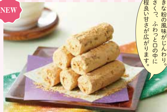
19 手造り五家宝 ¥1,290 (税込) 軽

特定原材料：なし 内容量：化粧箱 6本入×3袋 賞味期限：90日 (株)ワタロー