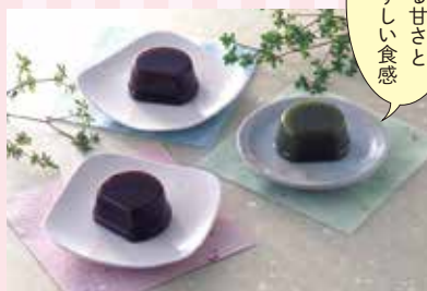
20 井村屋 カップ水ようかん ¥1,620 (税込) 軽

特定原材料：無し 内容量：12個 (煉/4個 抹茶/4個 小倉/4個) 賞味期限：13ヶ月 井村屋(株)