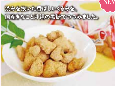
18 きなこくるみ ¥980 (税込) 軽

特定原材料：無し 内容量：210g (7g×30袋) 賞味期限：150日 (有)丹野製菓