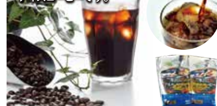
31 コールドブリュアー 水出しアイスコーヒー ¥1,250 (税込) 軽