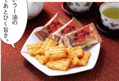
26 めっちゃうまー油あられ ¥750 (税込) 軽

特定原材料：小麦・乳 内容量：135g (個装紙込み) 賞味期限：210日 森白製菓(株)