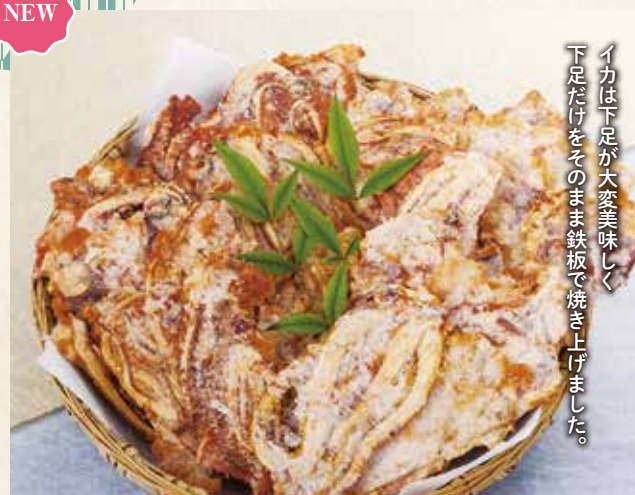
24 いか下足焼き 素焼き ¥1,080 (税込) 軽