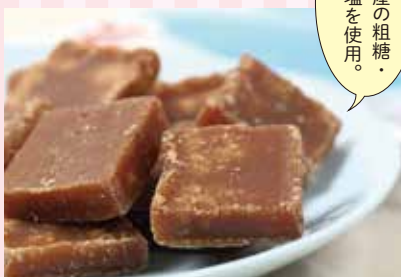
21 徳用 沖縄の塩黒糖 (ピロ) ¥1,160 (税込) 軽