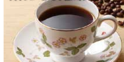
30 ドリップバッグ スペシャルブレンド ¥1,380 (税込) 軽