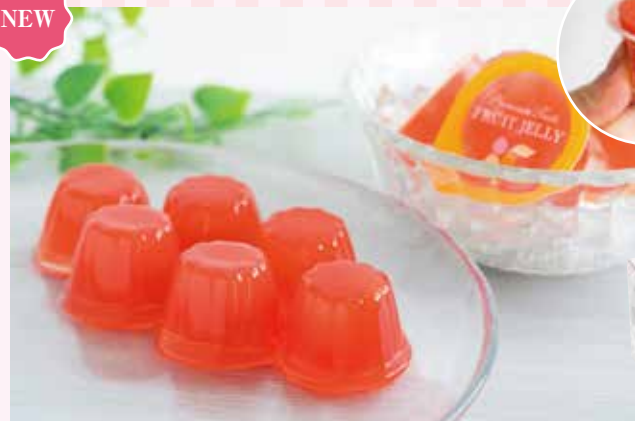
17 山形県産 佐藤錦 さくらんぼひとくちゼリー ¥1,290 (税込) 軽