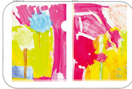
④ ホビー (A4 クリアファイル) 350 円