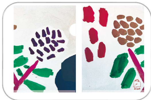
① あじさい (A4 クリアファイル) 350 円