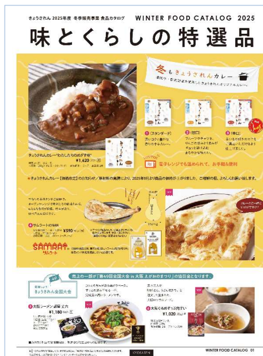
味とくらしの特選品(食品)カタログ

個人宅配もお受けします。ご希望の方はご注文の際に、下記「個人宅配希望」にご記入いただき、注文書とご一緒にお申込ください。請求書はご注文された方へ「社会福祉法人あまね」より発行いたします。送料についてはきょうされん直送 1 件につき 660 円（食品・雑貨は別発送）、注文に応じて発送します。詳しくはお問い合わせください。