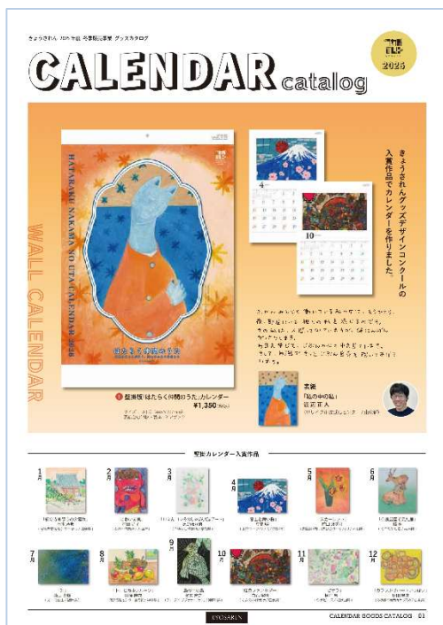
カレンダー(グッズ)カタログ